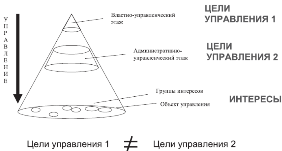
Источник: [19, с. 5].

Одной из составляющих общей управленческой культуры является экономическая культура как